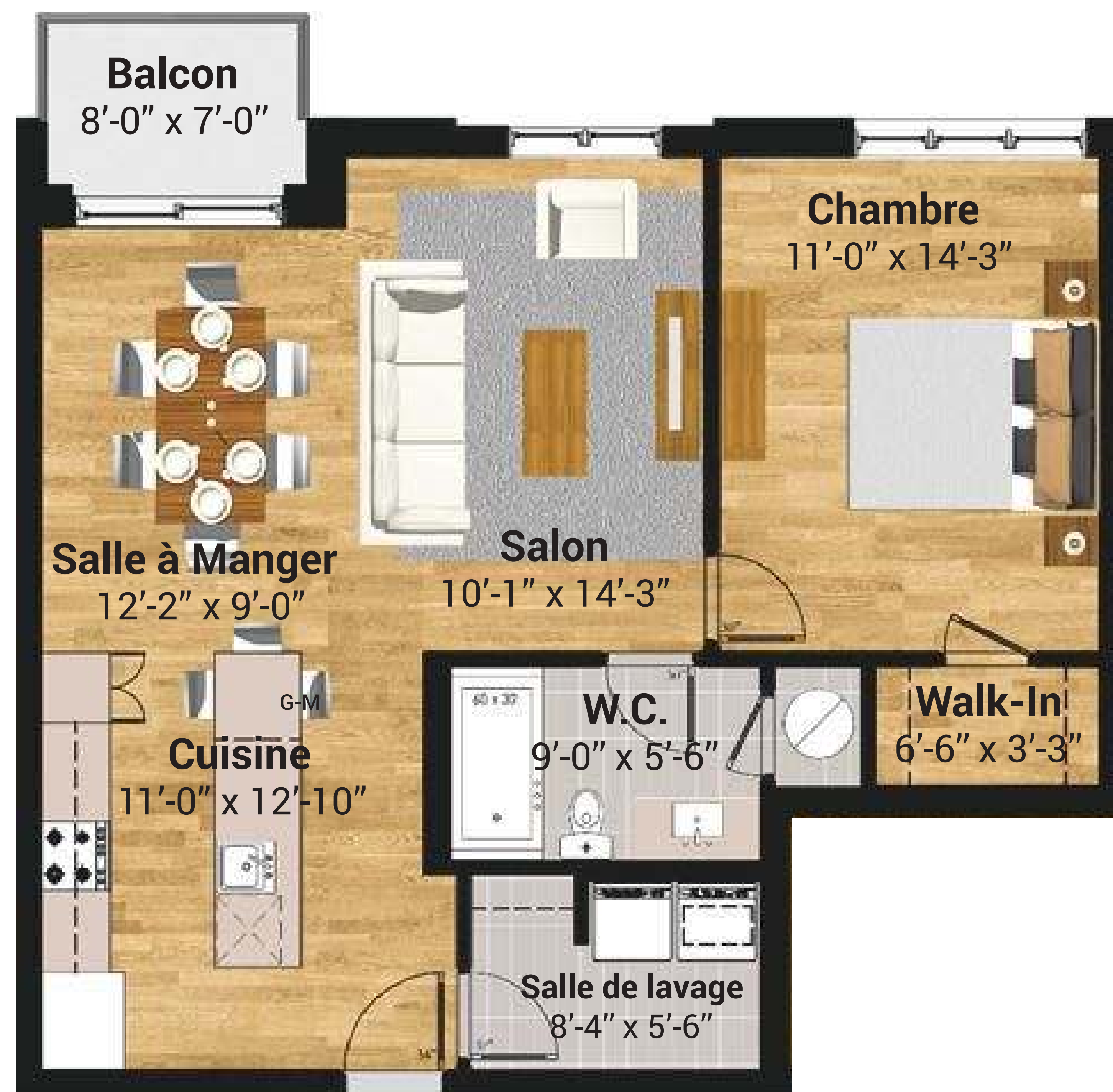
Plan concept de l'unité