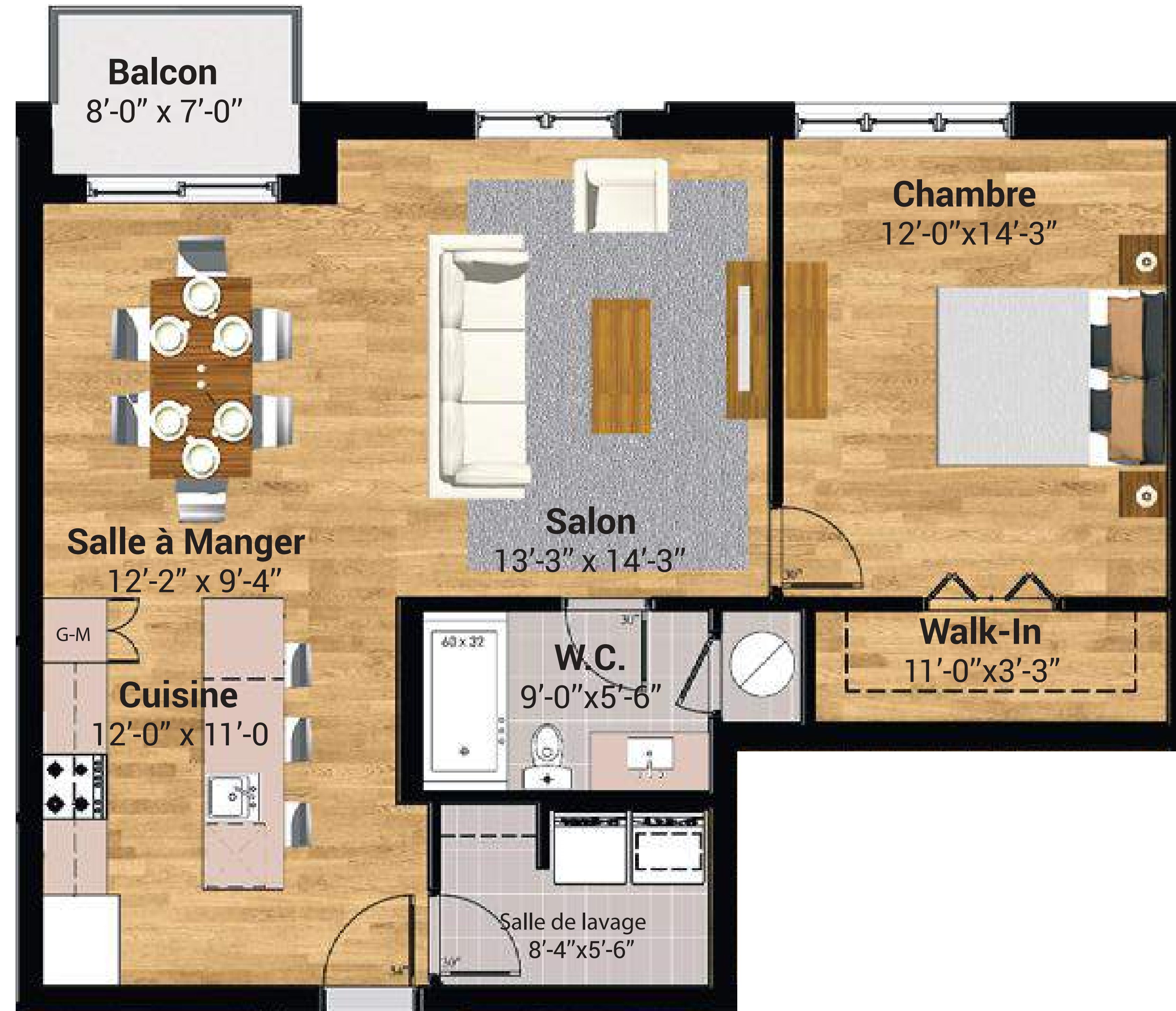
Plan concept de l'unité